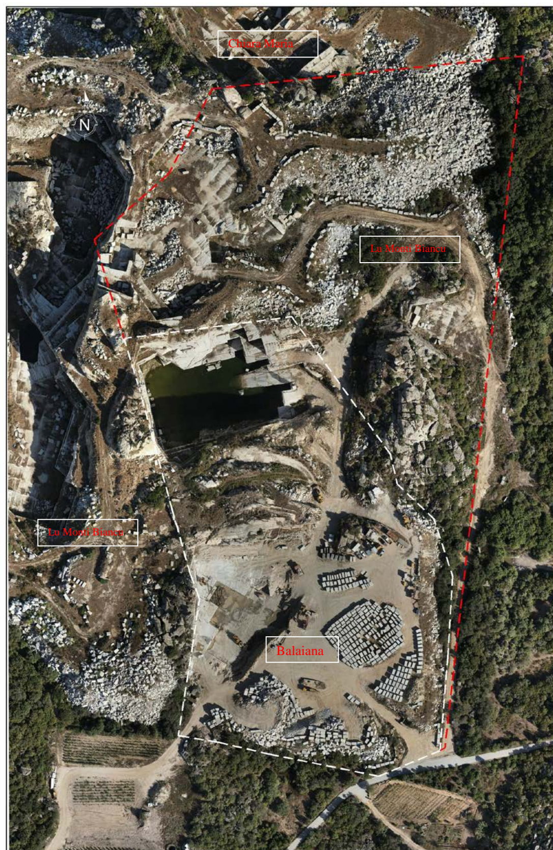
-Foto aerea dell'area di cava- Rif. settembre 2023